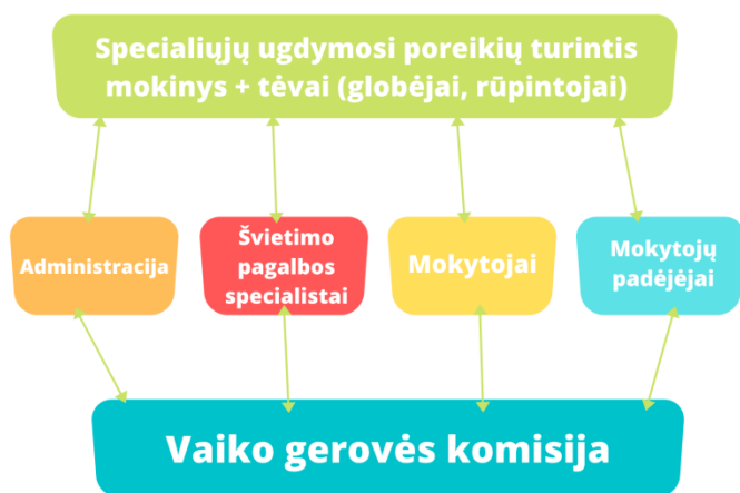
2 pav. Vaiko gerovės komisija

Mokyklos bendruomenės sutelktumas, įstaigos vadovų, pedagogų, švietimo pagalbos specialistų, mokytojų padėjėjų, mokinių ir jų tėvų (globėjų, rūpintojų) bendradarbiavimas, atsakomybių pasidalijimas, priimančias sprendimus, ugdymas, pagrįstas mokinio galiomis, atvirumas kaitai ir lankstumas bei nuolatinis ugdytojų įtraukiojo ugdymo kompetencijų tobulinimas – tai pagrindiniai sėkmingo nuotolinio ugdymo(si) ir pagalbos užtikrinimo veiksniai.